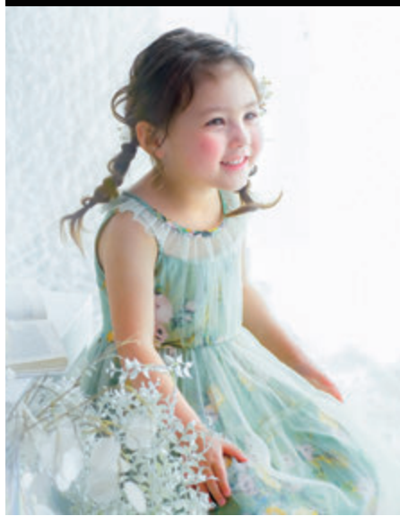
for 3 years old Girls